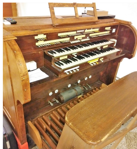
Oskalyd-Kinoorgel