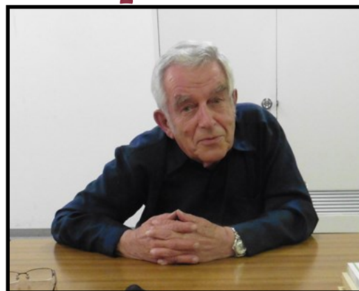
Kansai Seminar House 2017

Als Vorsitzende hatte ich die Möglichkeit ihn besser kennenzulernen. Von Anfang an beriet er mich, erzählte mir vieles über die Geschichte unserer Gemeinde, unterstützte uns bei den Vorbereitungen zur Weltausstellung Reformation und stand uns als Zeitzeuge für unser geschichtliches Video zur