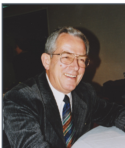
Im Gemeindesaal Dez 1996