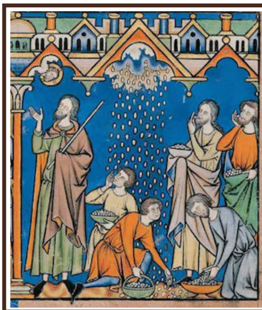
Manna, Illustration aus Crusader Bible, Paris, France, 1240, Morgan Library and Museum, New York, https://www.themorgan.org/collection/crusader-bible/18