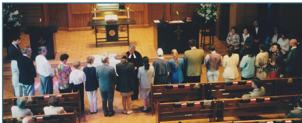
Abendmahl Ostergottesdienst 1998