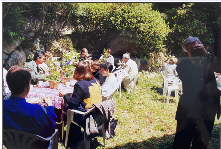
Osterfeier im Garten der OAG 2002(?)

(Fortsetzung von S. 3) die wir im Studienhaus der OAG in Kobe verbrachten, wurde unser Kontakt enger. Da wir eine wunderschöne Versammlungshalle verwalteten, kam es mitunter vor, dass besondere Anlässe in dieser Halle oder/ und im Garten zwischen Halle und Studienhaus stattfanden. Da erinnere ich mich an ein Osterfest, an dem eine große Gemeinde teilnahm, EKK- ebenso wie OAG-Mitglieder. Es war nach einem stimmungsvollen Ostergottesdienst ein fröhliches buntes Treiben, das ich mit einigen Schnappschüssen festgehalten habe. Auf einem