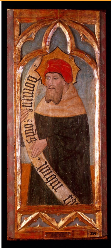
Prophet Micha 1450 - 1500, Anonymer Künstler, Nationalmuseum für alte Kunst, Lissabon.