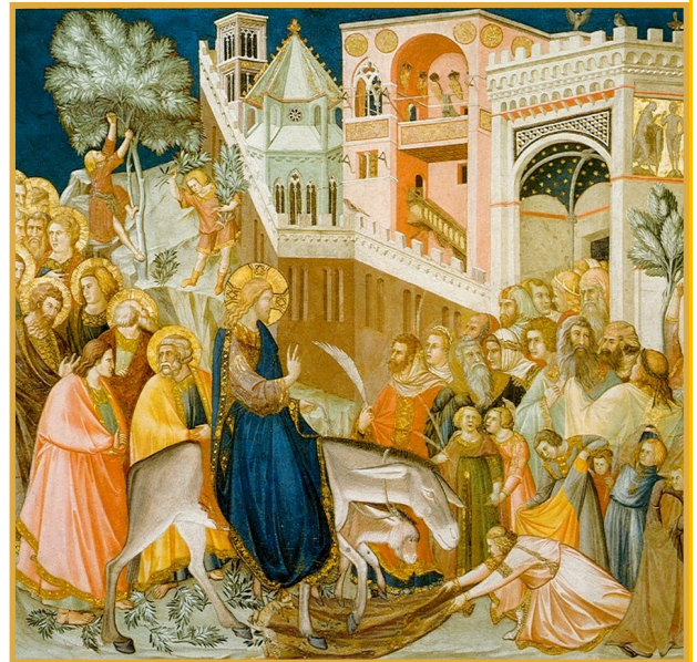
Einzug in Jerusalem, Pietro Lorenzetti (1280-1348), Freske in Basilika von San Francesco d'Assisi, Italien

und auf einem Esel reitend, auf einem Füllen, dem Jungen eines Lasttiers. 6 Die Jünger gingen und taten, was Jesus ihnen befohlen hatte, 7 brachten die Eselin und das Füllen und legten ihre Kleider auf sie, und er setzte sich darauf. 8 Eine riesige Men- schenmenge hatte auf dem Weg ihre Kleider ausgebreitet, einige schnitten Zweige von den Bäumen und breiteten sie auf