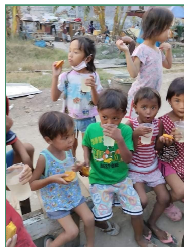
Kinder erhalten etwas zu essen und zu trinken

Deshalb sind wir in Zusammenarbeit mit der örtliche Kirche (Jesus is My Shepherd Christian Church) in Bliss Putatan, Muntinlupa City auf den Philippinen und ihren Helfern, auf