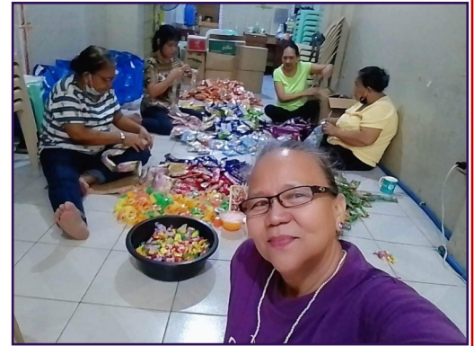
Gemeindemitglieder bereiten Tüten mit Süßigkeiten an Weihnachten in den Gemeinderäumen vor.

Viele Jahre lang habe ich unsere örtliche Kirche auf den Philippinen unterstützt. Wir haben Geld für die Organisation von Speisungsprogrammen, für Wohltätigkeits-