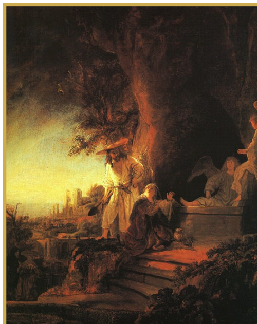
Christus erscheint Maria Magdalena, Rembrandt van Rijn (1638), Buckingham Palace

te sich um, und sie sieht Jesus dastehen, weiss aber nicht, dass es Jesus ist. 15 Jesus sagt zu ihr: Frau, was weinst du? Wen suchst du? Da sie meint, es sei der Gärtner, sagt sie zu ihm: Herr, wenn du ihn weggetragen hast, sag mir, wo du ihn hinge- legt hast, und ich will ihn holen.