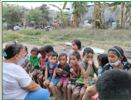
Straßenkinder beim Kindergottesdienst. Im Hintergrund sieht man ihre Behausungen.

Jetzt habe ich ein stabiles Leben. Doch wenn ich meine