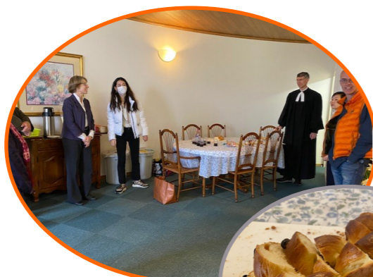
„Social distancing“ beim Abendmahl

Ostern im Jahr 2020 war sehr seltsam. Wegen der Coronakrise fand unser Gottesdienst zum ersten Mal Online statt. Um die Technik zu testen und den Gottesdienstablauf zu üben, sind wir am Tag davor zur Kirche gefahren. Ich bin mit dem E-Bike von Okamoto bis zur Kirche den steilen Berg hochgeradelt, weil ich nicht mit der Bahn fahren wollte. Dann haben wir uns lange mit der Technik beschäftigt. Ich hatte die Verantwortung für die Kameraführung