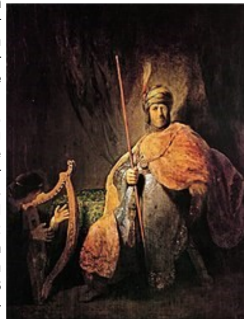
David spielt die Harfe vor Saul, Rembrandt van Rijn, circa 1630, Städelsches Kunstinstitut, Frankfurt

14 Der Geist des HERRN aber war von Saul gewichen, und ein böser Geist vom HERRN versetzte ihn in Schrecken. 15 Und die Diener Sauls sagten zu ihm: Sieh doch, ein böser Gottesgeist versetzt dich in Schrecken. 16 Unser Herr muss es nur sagen: Deine Diener, die vor dir stehen, werden einen Mann suchen, der es versteht, die Leier zu spielen. Und wenn der böse Gottesgeist auf dir ist, wird er in die Saiten greifen, und das wird dir gut tun. 17 Und Saul sagte zu seinen Dienern: Haltet Ausschau für mich nach einem Mann, der gut spielen kann, und bringt ihn zu mir. 18 Daraufhin sagte einer der Bur-schen: Sieh, ich habe einen Sohn von Isai, dem Betlehemi-ter, gesehen, er versteht es, zu spielen, ein Kriegsheld, ein Krieger, redegewandt, ein Mann von gutem Aussehen, und der HERR ist mit ihm. 19 Da sandte Saul Boten zu Isai, und er sagte: Schick David zu mir, deinen Sohn, der bei den Schafen ist. 20 Da nahm Isai einen Esel, Brot, einen Schlauch mit Wein und ein